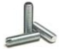
Vis sans tête fendue bout plat DIN 551 - ISO 4766